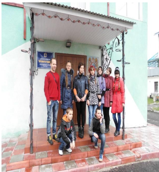
Відвідування дитбудинку в м. Тернополі